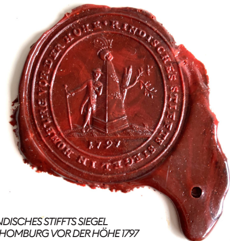
RIND'SCHES STIFTS SIEGEL IN HOMBURG VOR DER HÖHE 1797