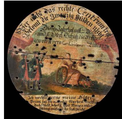
Freiheits-scheibe der Homburger Schützengesellschaft, 1770

Die Rind'sche Bürgerstiftung wird anlässlich des Doppeljubiläums – auf Anregung des Vereins für Geschichte und Landeskunde Bad Homburg v. d. Höhe – das Original des Testamentes aus ihrem Besitz dem Stadtarchiv an diesem Abend feierlich übergeben.